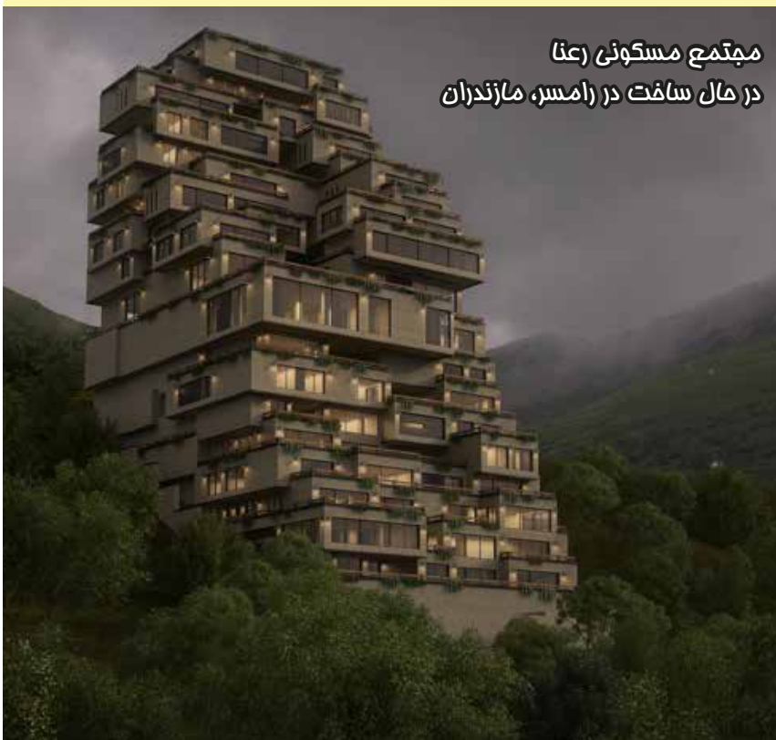
مجتمع مسکونی رعنا در حال ساخت در رامسر، مازندران

تا به امروز پروژه‌های برگزیده زیادی با کاربری‌های متفاوت مسکونی، ویلایی، اداری، تجاری، خدماتی، فرهنگی و شهرک سازی از ایشان به چشم می‌خورد، که در هر کدام می‌توان دیدگاه متفاوت ایشان به پروژه را به خوبی مس کرد. پروژه های معروف ایشان: