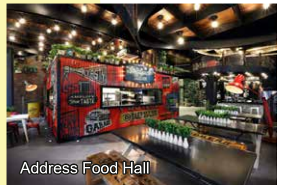
Address Food Hall