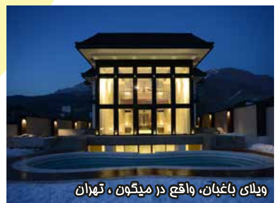
ویلای باغبان، واقع در میگون، تهران