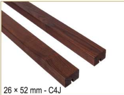
26 × 52 mm - C4J