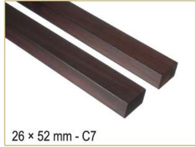
26 × 52 mm - C7