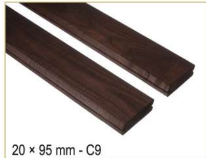
20 × 95 mm - C9