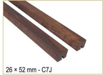
26 × 52 mm - C7J