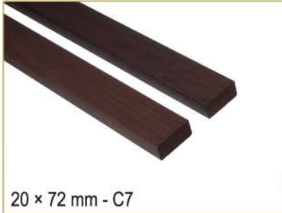
20 × 72 mm - C7

درخت زبان گنجشک یکی از گونه‌های گیاهان گلدار از راسته نعناسانان است. این درخت بیشتر بومی اروپا است و در شمال اسکانندیناوی رویده می‌شود. همچنین در جنوب غربی آسیا از شمال ترکیه تا شرق قفقاز و کوه‌های البرز می‌روید. چوب درخت زبان گنجشک بسیار سخت و محکم است. این درخت در جوانی دارای تاجی باریک و هرمی است که به تدریج به درختی سایه گستر تبدیل می‌شود. شرایط صحرایی، ساحلی و سازگاری آن به انواع خاک‌ها، زبان گنجشک را در ردیف یکی از گیاهان مقاوم در شرایط نامساعد قرار داده است. بیشتر جنگل‌های زبان گنجشک شمالی در بریتانیا روی بستری از سنگ‌های آهکی رشد می‌کنند. خاک مرطوب و غنی را ترجیح می‌دهد ولی در خاک‌های خشک و قلیائی نیز رشد مناسبی دارد و همچنین نور مستقیم خورشید و باد را تحمل می‌کند.